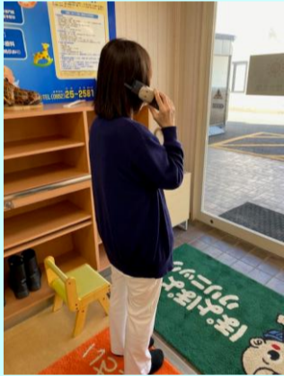
【消防署へ通報訓練】