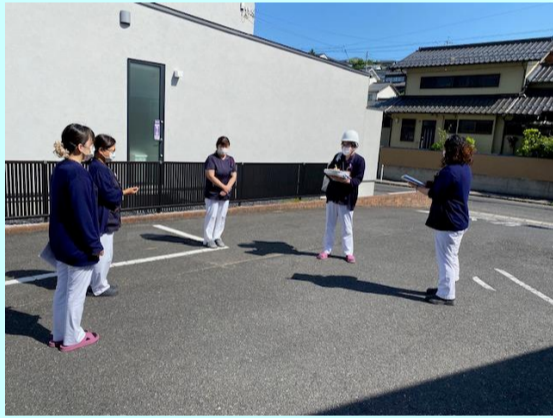
【避難後の報告と確認】