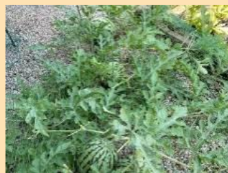
【ネットを張りました】

お蔭様でいよいよ収穫日を迎えて、つるをカット。冷蔵庫に入れて冷やし翌日に半分にカット。ドキドキしながらスイカを見ると皮が薄く真っ赤な果肉！見るからにおいしそう♪食べてみると、とても甘くて上出来でした。半分はキャストに差し入れして喜んでいただけました。今年は梅雨明けが早く晴天が続き甘〜いスイカが出来たのかなと推測しています。初収穫は本当に嬉しく大感動でした(^_^)♪