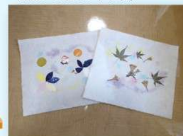
〈出来上がった和紙〉 自分で色付けや模様を作って 出来上がった世界に一つだけの和 紙です