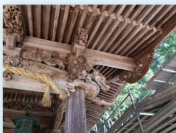
〈社殿の彫刻〉 龍などの精緻な彫刻が社殿全体に彫られていて、とても素晴らしいです。