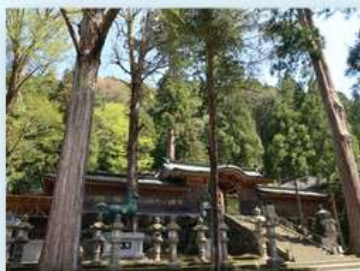
〈境内〉 とても静かで厳かな雰囲気です