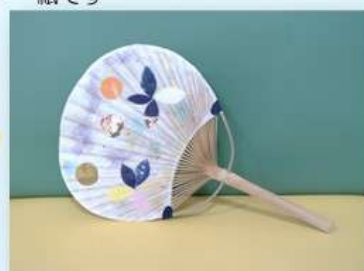
〈うちわ〉 作った和紙でうちわを作りました。 今年の夏に活躍してくれそうです。