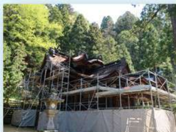
〈社殿〉 屋根が幾重にもなっていて 複雑な造りです