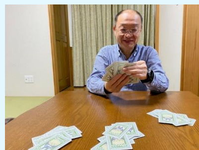
4山配り、イイ手が来たとき