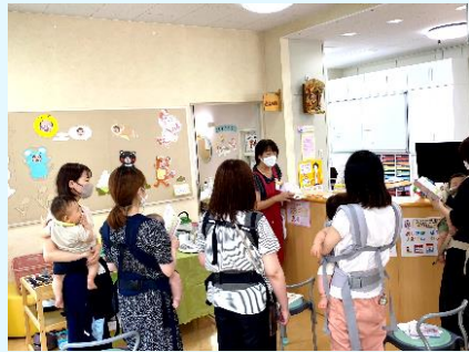
【にこにこお話タイムの様子】