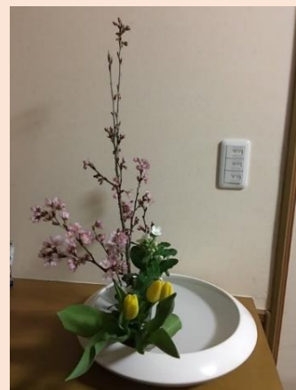
【桜・チューリップ】