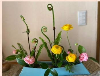
【ぜんまい・椿・ランタンキュラス】

お花を見ることで私の癒しになっています。庭のお花を花瓶にさして食卓や玄関に飾ったり、最近では山野草が好きで友人に株を分けていただき庭に植えています。生活の中に、お花があることで心が和みます。