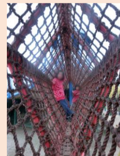
2015年 公園で遊ぶ子ども達