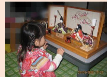
2008年 木目込みのひな人形にくぎ付け