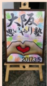
2017年 大阪思いやり塾

写真フォルダーに納めてある頃と今とはいろいろ違いがありますが、今年も家族でお花見ができるといいなあと思います。