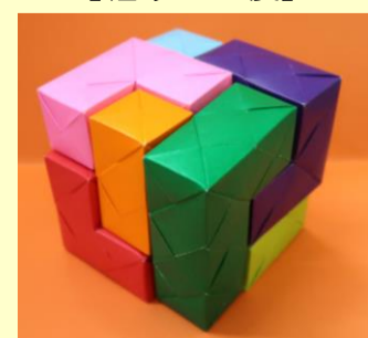
【ソーマ・キューブ：立体パズル（素作）】