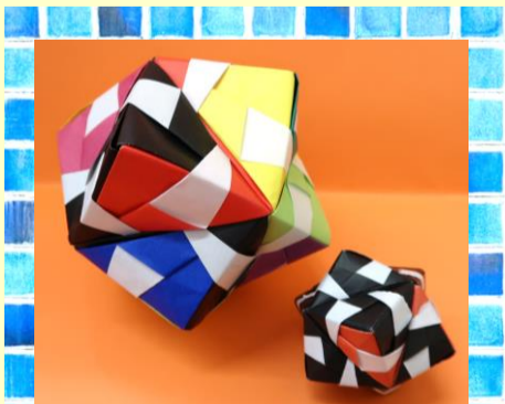
【ぼよぼよ折り紙フレンド作】