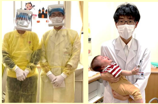
【医学生さん臨床実習】

患者様には、ご協力をいただき大変感謝しております。この場をお借りしてお礼を申し上げます。