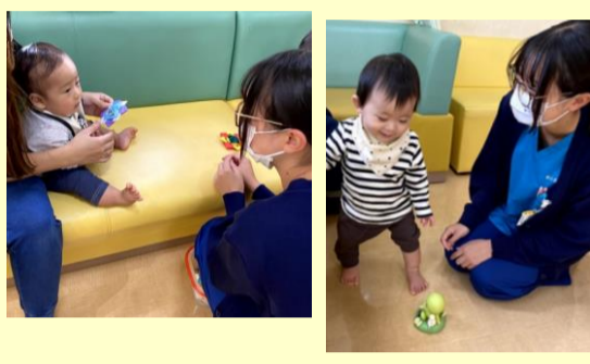
【高校生さんインターンシップ】