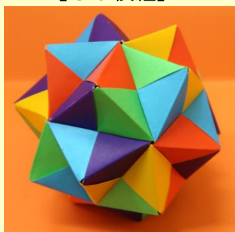
【園部式ユニット折り紙（素作）】