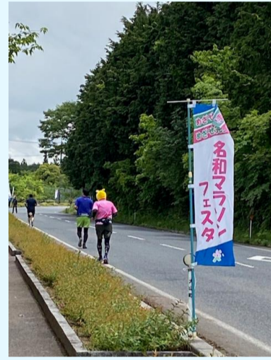
【最後の長～い上り坂】

A コロナ禍の3年間は月1回のマンスリーランナーになっていて、めちゃくちゃスピードが遅くなっていました。3月からにわかウィークリーに練習を始め14キロの練習ランを11本行って制限時間の5分前に何とか完走することが出来ました。応援してくださる皆さんと同行してくれる奥さんに感謝です(^_^) 練習は裏切らなかったです！