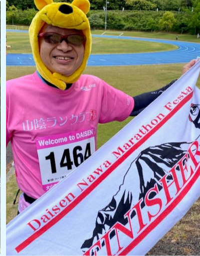
【ハーフマラソン完走】