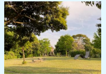
【ぽよぽよ先生の練習中、私はウォーキング】