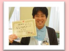
日本折紙協会認定 折り紙講師