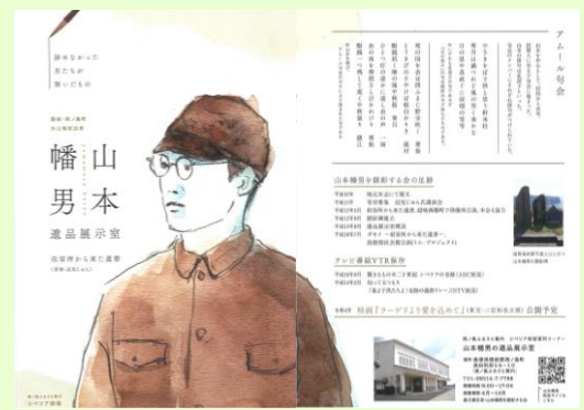
【山本幡男の遺品展示室パンフレット】