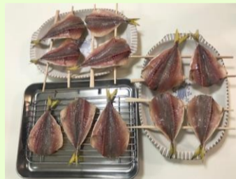
【串に刺して空気に触れるようにしています】