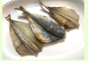
【たくさん出来ました】