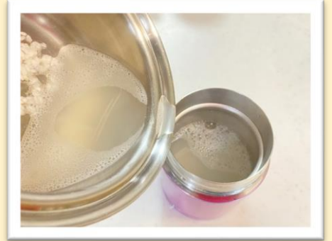
一度スープジャーに入れて (スープジャーを温めます) 再び鍋に移し沸騰させます