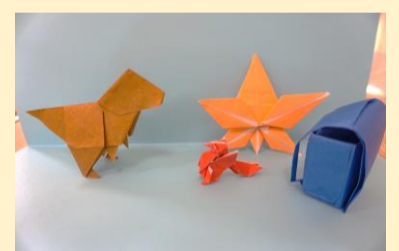
恐竜やランドセル