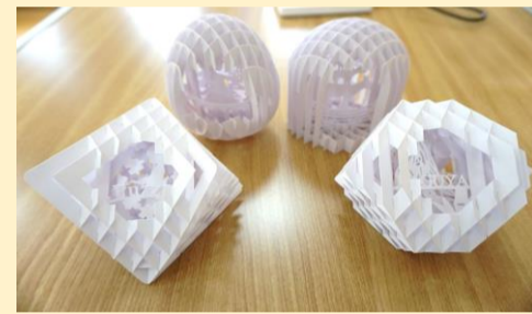
【ポップアップカード】

まだまだ家の中で過ごす時間が多い中ですが、みなさんもこんな楽しみ方はいかがでしょうか