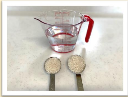
水 300ml お米 大さじ2杯

もぐもぐ広場で伊藤先生が説明されるスープジャーを使ってお粥作り♪ とっても簡単にできますのでご紹介します。今回は10倍粥です。