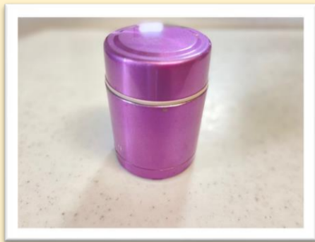
蓋をして30分～40分 置きます