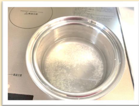
お米を洗って30分 おきます