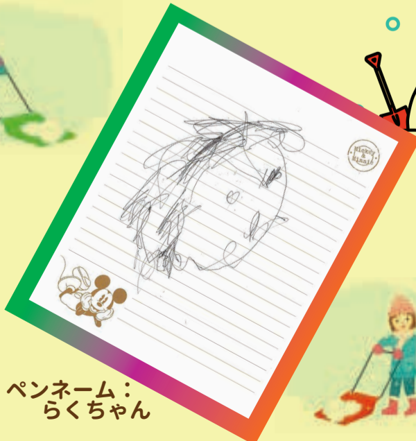
ペンネーム： らくちゃん