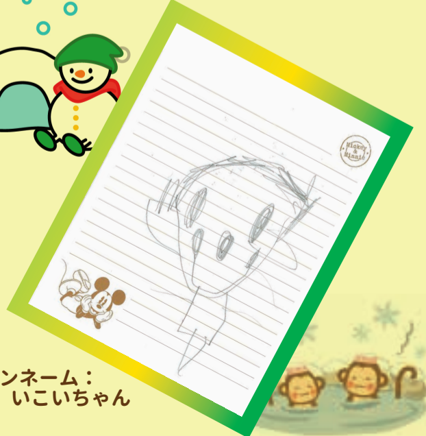
ペンネーム： いこいちゃん